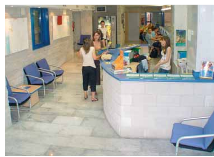
Recepción de Enforex Alicante

→ De compras En torno a la Avenida Alfonso X el Sabio y la Calle Gerona hallará el centro tradicional de compras, y en la Avenida de Maignave y calles aledañas la nueva y pujante área comercial. A lo largo del Paseo del Doctor Gadea en invierno, y en la Explanada en verano, se ubica un mercadillo polivalente en el que adquirir desde ropa informal hasta cerámica, pasando por bisutería y objetos de decoración. Si es persona de buen paladar, le recomendamos un paseo por el Mercado Central.